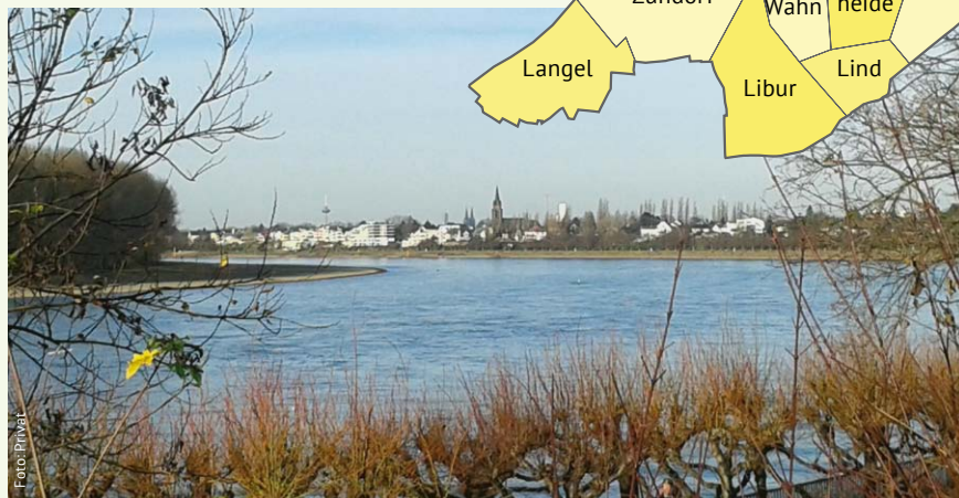
Vom Porzer Bezirksrathaus über Ensen Blick zum Kölner Dom

Wie wir an 80 Sportvereinen, zahlreichen Chören, 30 Karnevalsgesellschaften oder zwölf Bürgervereinen sehen, pflegt die Porzer Bevölkerung ein ausgeprägtes Vereinsleben. Ihr großer ehrenamtlicher Einsatz zeigt sich z. B. in der Hilfe für Geflüchtete, bei der Tafel oder in der Senior*innenarbeit. Generationenübergreifend und multikulturell fanden 2022 die Porzer Klimakonferenz und die erste Porzer Klimawoche statt. Wir haben eine